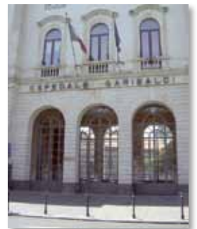
• Ospedale Garibaldi

Felicitaciones a nuestros estudiantes quienes, una vez más, representaron al IUNIR de la mejor manera.