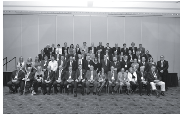
• Rectores Argentinos en Guadalajara 2010

Hola a todos en el IUNIR. Hoy comenzó el encuentro de Rectores que está muy bueno. Es un encuentro con más de 1000 Rectores. Hace calor y el tiempo está muy bueno. La actividad es muy intensa y requiere una dedicación full-day, pero vale la pena. Es muy participativo y nos presentamos muy bien como Institución Argentina. Hay autoridades del Ministerio de Educación y Rectores de Universidades de nuestro país. Desde el IUNIR hemos realizado tres aportes a las principales ponencias: 1) Formación del docente (se presentó contenido del libro recientemente editado por el IUNIR sobre Didáctica), 2) "Internacionalización y cooperación internacional" . Presentamos la Red Ibero americana de investigación de la calidad en Educación Superior: RIAICES y 3) "Globalización y educación Superior en Latino América" . Los aportes están publicados en http://encuentroguadalajara2010.universia.net/blogs.html Aquí les mando algunas fotos. Que estén todos bien y hasta pronto.