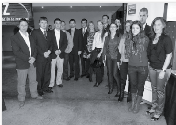
• Los mejores promedios de cada Universidad.

Felicitaciones a nuestros estudiantes por este importante reconocimiento que nos enorgullece como Institución.