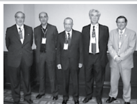
• Rectores Argentinos en Universia