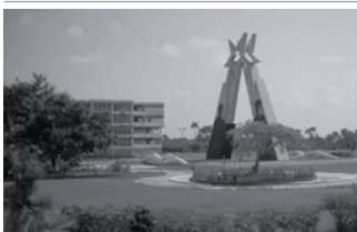
• Pinar del Río - Cuba