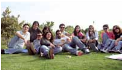
• El grupo de estudiantes en un descanso.