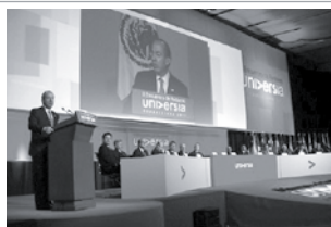
• Presidente de México inaugurando el encuentro