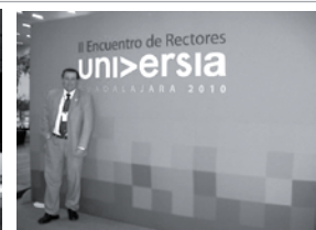
• En el Encuentro de Rectores de Guadalajara